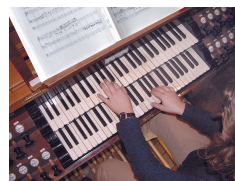
Albrecht E. Arnold_pixelio.de

Sie gibt regelmäßig alle Infos über Veranstaltungen, Aktivitäten und Gottesdiensttermine an die Zeitung, die Amtsblätter und stellt diese ins Internet.